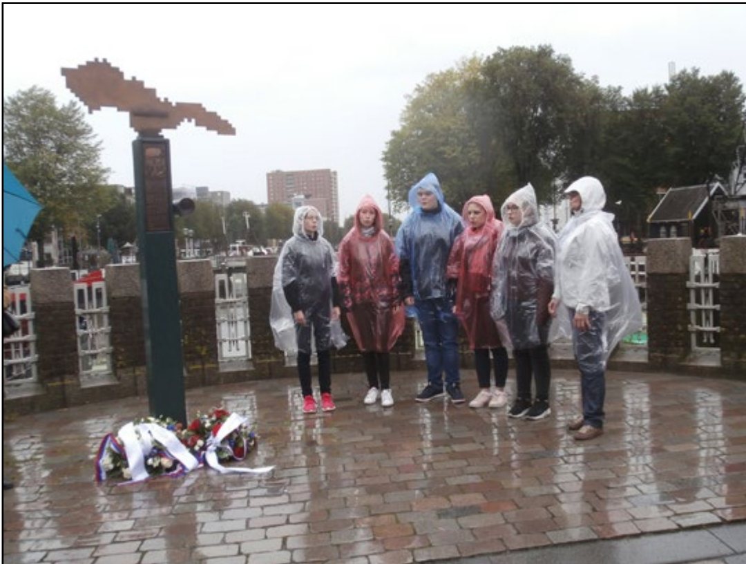
Koortje zingt Tsjechische en Slowaakse volksliederen.