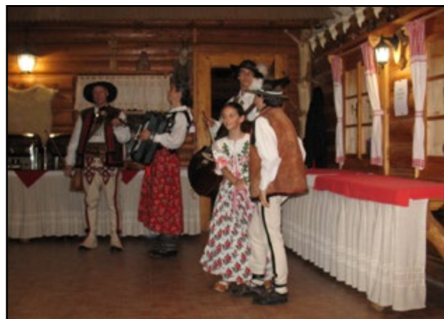
Vrolijke verrassing in de koliba in Zuberec.

Maandag 30 april bezoeken we kort de “antieke” hoogovenruïne Frantiskova Huta en het dorpje Podbiel, met originele houten huizen. Daarna is het een flink eind rijden naar het noorden om in Oravská Polhora een boswachtershuis/museum te bezoeken. De bekende Slowaakse schrijver/dichter Hviezdoslav vond hier zijn rust en zijn literaire inspiratie. En dat geloven we zeker. Want de omgeving is prachtig. Vervolgens gaan we richting Dolní Kubín. Met een koffiestop in Namestovo. Bij het meiboom-volksfeest in Dolní Kubín verdubbelt het aantal feestgangers door onze komst. Wel wordt er enthousiast gezongen op het podium. Maar zitplaatsen zijn er niet. Dus zit iedereen op de stenen randen rond de beplanting op het plein. Het lekkere warme zonnetje vergoedt dit eigenlijk mislukte volksfeest. Dit keer geen diner in het hotel, maar in een Koliba in het nabijgelegen Zuberec. Na het eten een geweldige verrassing. Het optreden van een muzikale familie met prachtige volksmuziek, zang en dans. Dit is echt genieten! (foto 2711)