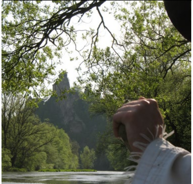
Zicht op Oravský hrad vanaf het water.