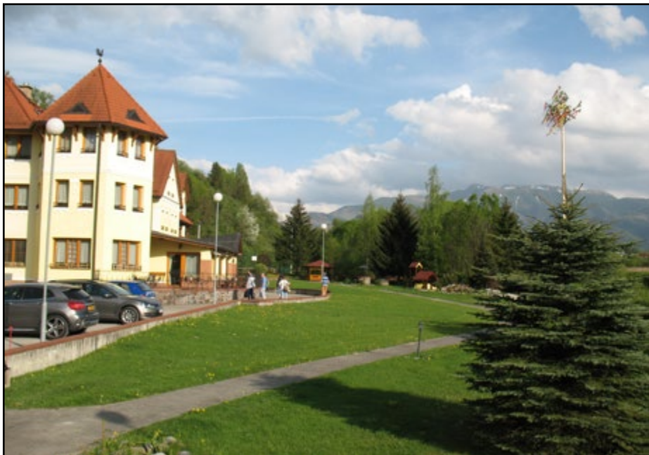
Hotel Julianin Dvor