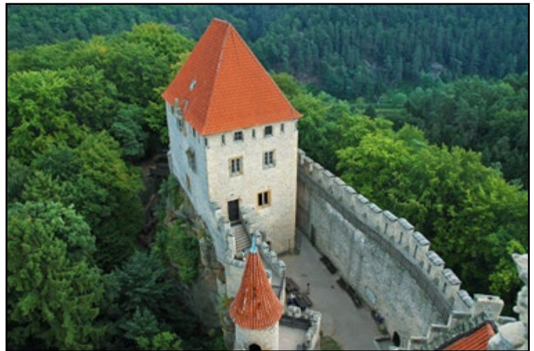
Kokorin kasteel

Ontsnap aan de drukte van Praag en geniet van de rust en ruimte in één van de vele natuurparken van Tsjechië. Op slechts een uurtje rijden van Praag ligt het natuurpark Kokořín. Dit glooiende landschap met bossen, kristalheldere meren, sprookjesachtige ruïnes en zandsteenrotsen is ideaal voor een mooie fiets- of wandeltocht. Hoog boven de bossen torent het Kokořín-kasteel uit. Het kasteel met haar cilindervormige toren werd beschouwd als één van de “vervloekte kastelen” en was vaak een toevluchtsoord voor rovers.