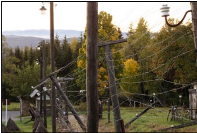
IJzeren gordijn